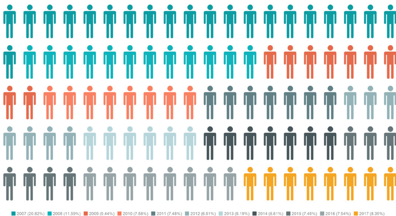
Figura 2. 2.613.493 cetățeni români au emigrat numai în perioada 2007-2017

cetățeni români au emigrat, potrivit cifrelor INS.